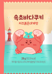
2025년도 속초시 지식재산 첫걸음 지원사업 포장디자인개발 / 포장, 캐릭터 브랜드