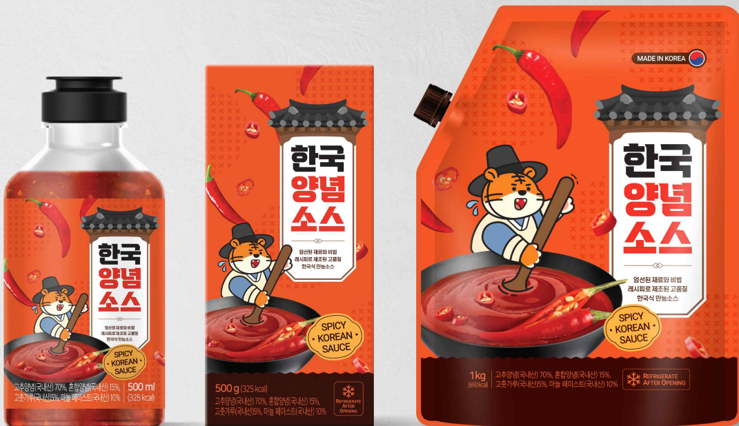
2025 강원특별자치도 수출상품 포장디자인 지원사업 / 닭갈비 양념 소스 포장 디자인